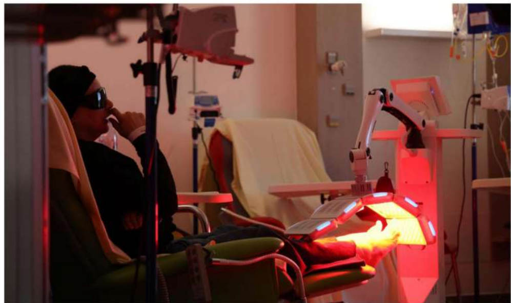
Le pôle, inauguré en novembre, offre une prise en charge innovante des patients, qui s'appuie sur un accompagnement préventif, curatif et personnalisé.

Les soins de rééducation s'appuient sur deux appareils de pointe, qui travaillent en complémentarité : la photobiomodulation, qui accompagne les processus naturels de réparation tissulaire, et l'endermologie (appareil "ICOONE"), qui aide dans le traitement des cicatrices en mobilisant et revitalisant les tissus de façon indolore. Ces technologies de haute précision permettent, grâce à des ajustements de longueurs d'onde, de cibler les zones et fibres spécifiques pour répondre efficacement à chaque besoin : les mains, les pieds ou les zones opérées, irradiées, notamment le sein ou la sphère ORL.