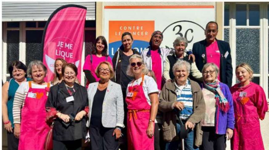
La Ligue contre le cancer et ses bénévoles aixois se mobilisent cette année encore contre le cancer du sein.